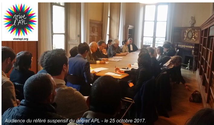
Audience du référé suspensif du décret APL - le 25 octobre 2017.

Le SNUP agit pour le retrait de l'article 52 du PLF 2018 et œuvre pour un véritable débat sur le logement social.